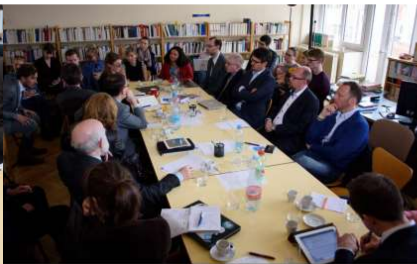
Forum Droit / Études aréales / Relations internationales

Plus d'une centaine de chercheurs d'une large partie des institutions scientifiques de République tchèque y ont participé (UK, AV ČR, Universités de Pardubice, Ústí nad Labem, Hradec Kralové, Plzeň, Brno, École supérieure d'économie – VŠE, Université Metropolitní, Université d'Agronomie, Institut des relations internationales, etc.).