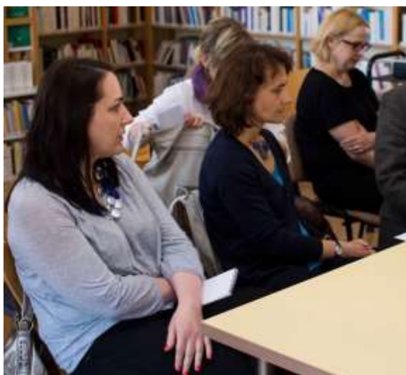
Forum Études juives